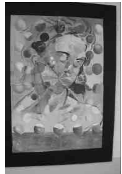
GALATEA DE LAS ESFERAS (1952).