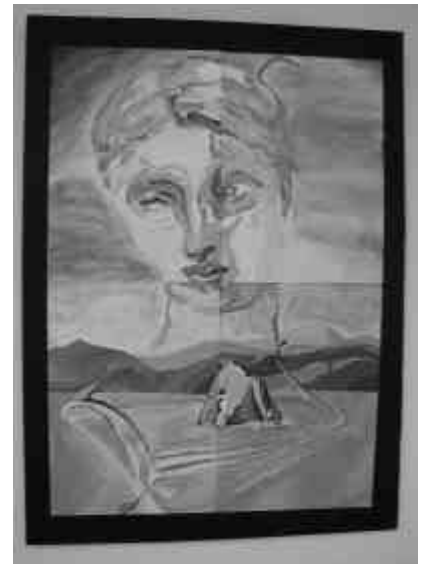
NACIMIENTO DE UNA DIVINIDAD (1960)