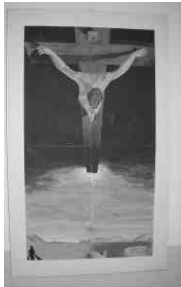
CRISTO DE SAN JUAN DE LA CRUZ (1951).