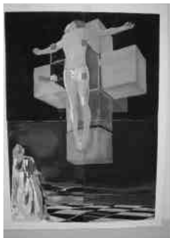
CRUCIFIXIÓN O CORPUS HYPERCUBICUM (1954).