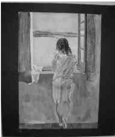
MUCHACHA EN LA VENTANA (1925)

Es esta página se exponen algunas de estas reproducciones.